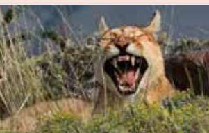
Panteras Andoni Canela

SÁBADO · 4 DE ABRIL · AUDITORI MUNICIPAL Avenida de la Murà, 1