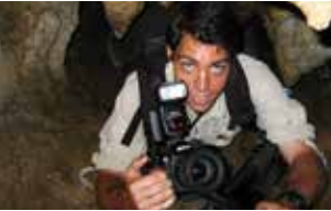
Conservación y fotografía Joan de la Malla