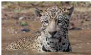
Pantanal, el reino del jaguar José M a Fernández Díaz Formentí