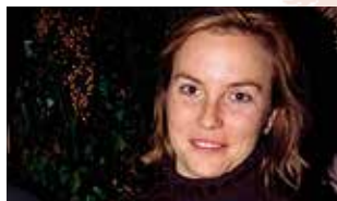
Un hombre en la Tierra Odile Rodríguez de la Fuente