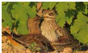
Humedales del sur de Alicante Antonio Sáez