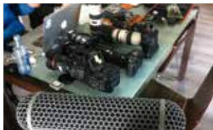
Sonidos de la naturaleza Juanjo Ballester